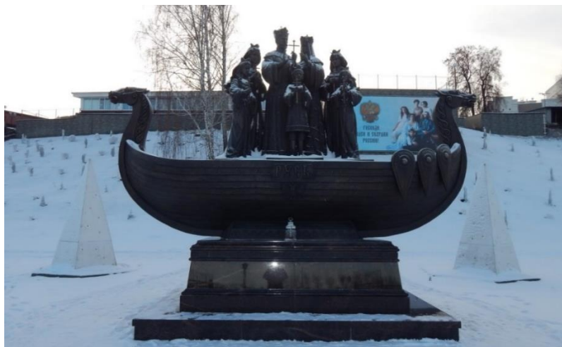
Fig. 4. Monument to the family of the former Emperor Nicholas II. Bogoroditse-Rozhdestvensky Monastery (Tyumen, 29, 25th October Str.). November 24, 2022

Discussion. As a result, during writing the research paper there are 4 art objects located in Tyumen, 3 of which are not included in the Register [39]. The commemorative signs were installed in the period from 2001 to 2020 . All objects are in a private area, located in the immediate vicinity of the railway station “Tura”: 2 objects on the right side and 2 – on the left (diagram).