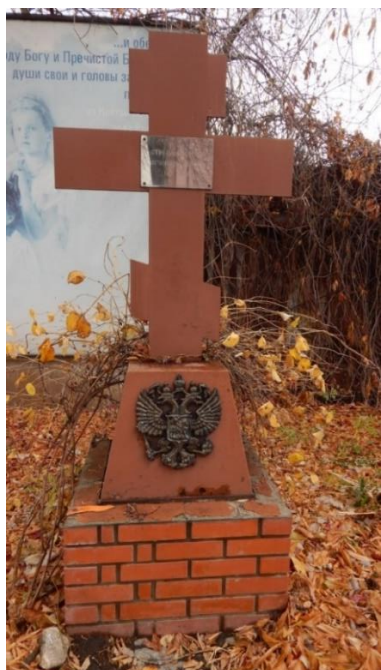
Fig. 2. The Cross of Worship, installed at the initiative of the Siberian Cossacks. The Tsarskaya Pristan Center (Tyumen, 3, Gosparovskaya Str.). November 3, 2022