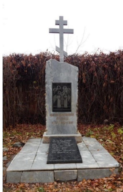
Fig. 3. The Cross of Worship, installed at the initiative of parishioners. The Tsarskaya Pristan Center (Tyumen, 3, Gosparovskaya Str.). Photo by E. Makarov, November 3, 2022

Despite the presence of navigation signs leading to the “Tsarskaya Pristan” in the historical part of Tyumen [42], these signs are inaccessible to most tourists and residents of the city. The monumental objects are visited by people who have visited the exposition or individual persons who want to worship the crosses. On the other hand, citizens, who visit this place, receive information from its employees about the purpose of the signs and about the persons memorialized by their installation. Explanations are especially relevant in case of mistaken perception of signs as a grave place. Perhaps, the reason is the view of the signs, which resemble graves, as well as the tradition in the Russian Orthodox Church of burying priests on land adjacent to city temples or monasteries.