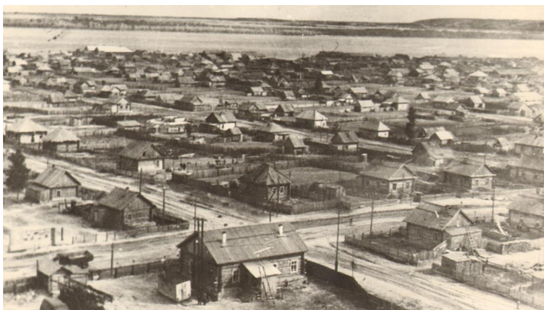
Рис.4 Вид на посёлок Чёрный Мыс. Внизу контора Сургутской нефтеразведочной экспедиции и дома геологов, 1959 г. Из фондов Сургутского краеведческого музея СКМ НВ-1696