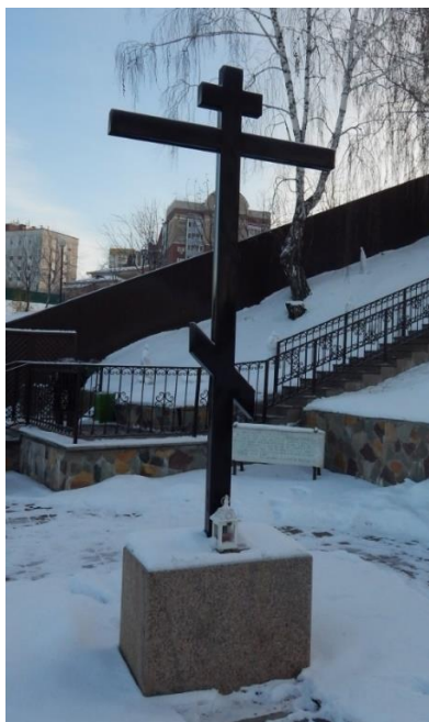
Fig. 1. The memorial sign “The Emperor's Pier”. Bogoroditse-Rozhdestvensky Convent (Tyumen, 29, 25th October St.,). November 24, 2022

According to the Register Information, the wooden memorial cross is designated as a memorial sign “The Emperor's Pier”, next to which there is a memorial plaque with a text – quote from the diary of Nicholas II (Fig. 1) [39]. The complex is located on the territory of the convent, which has a fence and is restricted for free access. Therefore, according to the Regulation, the placement of this commemorative sign does not require the Administration of Tyumen to make any decisions on the installation of the object [28]. It is worth noting that the Department of Culture of the City Administration Tyumen has not received “...proposal for installation (demolition) of the Object from interested parties in accordance with the Regulation” [24].