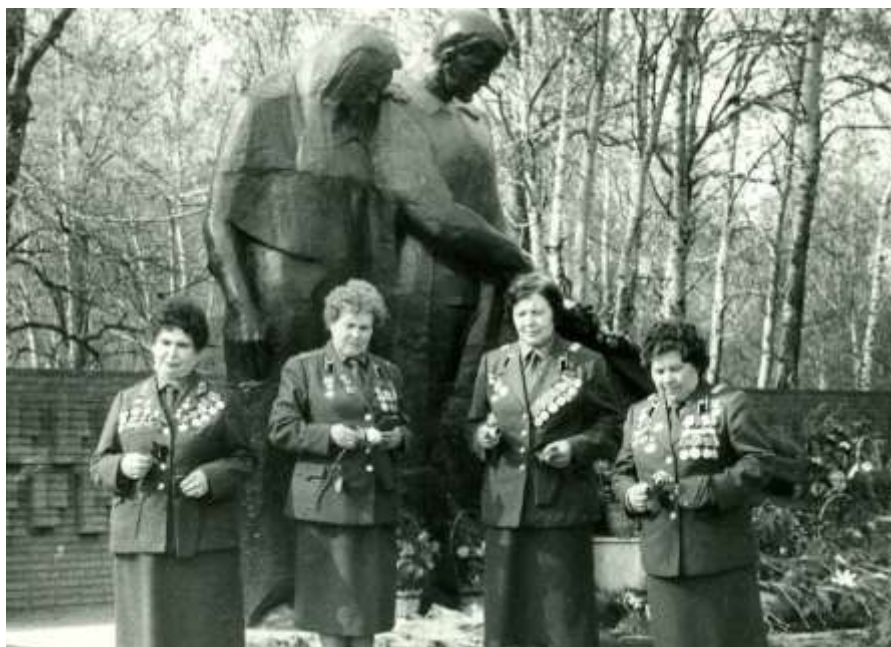
Рис. 1. Участницы Великой Отечественной войны (1941–1945 гг.), боевые подруги на площади Памяти. Групповой портрет. г. Тюмень. [1975]. Автор съемки не установлен. ГБУТО ГАСПИТО. Ф. 4063. Оп. 1. Д. 44.

Несмотря на проведенные работы, в 1982 г. оставалась актуальной проблема его сохранения памятника, а также формирования и благоустройства прилегающей территории. В источнике отмечено, что «братская могила умершим от ран в госпиталях не имеет постоянного шефа, нет надлежащего ухода, необходимо данный памятник отделить от зоны городского кладбища» [6, л. 27].