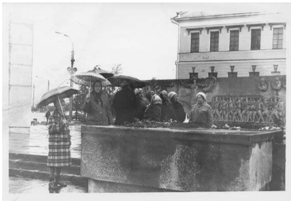
Рис. 3. Возложение цветов ветеранами, выпускниками (1930 года выпуска) средней школы № 1 г. Тюмени, к памятнику «Вечный огонь». г. Тюмень. 25 мая 1980 г. Автор съемки Протопопов В. ГБУТО ГАСПИТО. ФФ. Оп. 1. Д. 456.

Сведения другого документа также указывают на вопросы, связанные с сохранением и использованием мемориала: «сегодня даже негде провести митинг в день 9 мая. Вечный огонь – у дороги, в тылу у него – помойка, стела давным-давно закоптилась, и никто не думает о её состоянии» [6, л. 62].