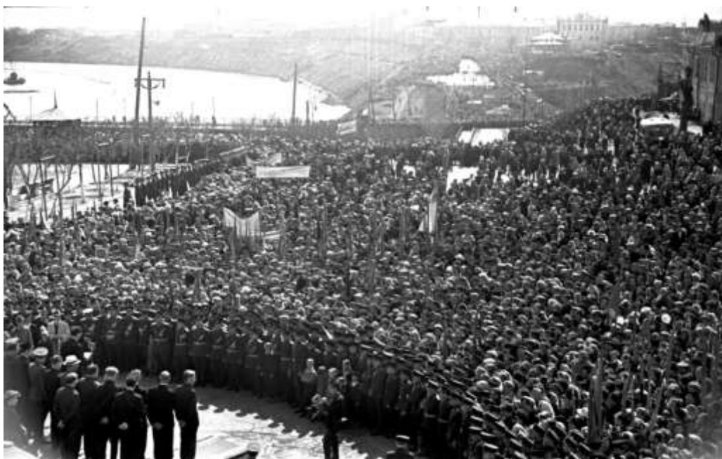
Рис. 2. Участники общегородского митинга, посвященного закладке обелиска и мемориала «Вечный огонь» в честь Победы советского народа в Великой Отечественной войне (1941–1945 гг.) на площади у здания Тюменской школы-интерната № 1 (ныне здание ФГБОУ ВО «Тюменский индустриальный университет»). г. Тюмень. 1965 г. Автор съемки – Сапожков И.И. ГБУТО ГАСПИТО. ФФ. Оп. 2. Д. 783.

Важным этапом в истории создания мемориала расположенного на Исторической площади (далее – мемориал № 2) являлся выбор места его размещения в культурном ландшафте города. Наиболее значимые объекты располагались по традиции на территории публичных, открытых для посещения горожанами площадей и скверов. В частности, монумент, посвященный «ратному и трудовому подвигу тюменцев» [30, с. 65], был расположен на одном из самых высоких мест в городе [22, с. 136], что подчеркивало исключительную значимость Победы советских войск в Великой Отечественной войне. Композиция установлена в годовщину события: 09.05.1968 г. [20; 27] (см. рис. 2).